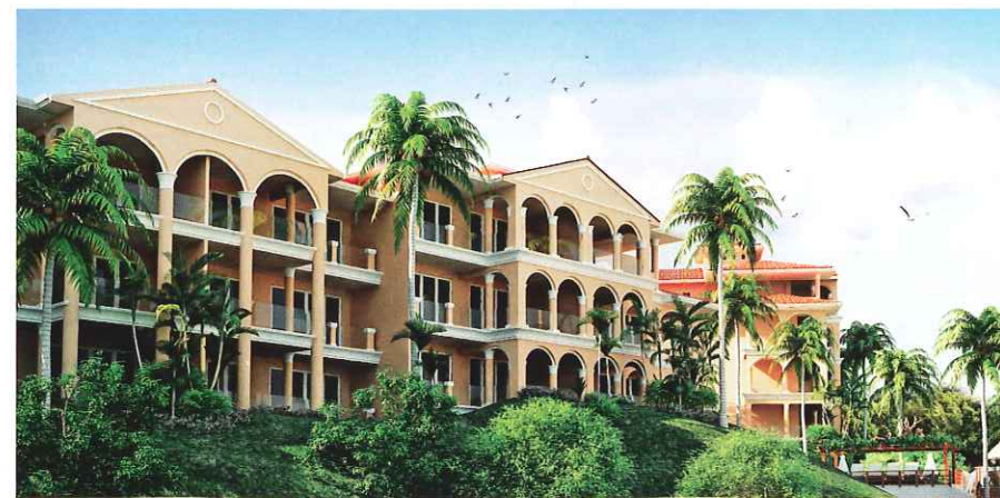
El cliente puede construir la casa de su preferencia o escoger un lujoso apartamento | The customer can build the home of its choice or choose a luxurious apartment.

Isla Viveros inicia a partir de octubre la construcción de un boutique hotel, que tendrá capacidad para 60 habitaciones. Además, ofrece lotes frente al mar que varían entre 2,820 y 8,700m 2 y el cliente tiene la oportunidad de construir la casa de su preferencia,