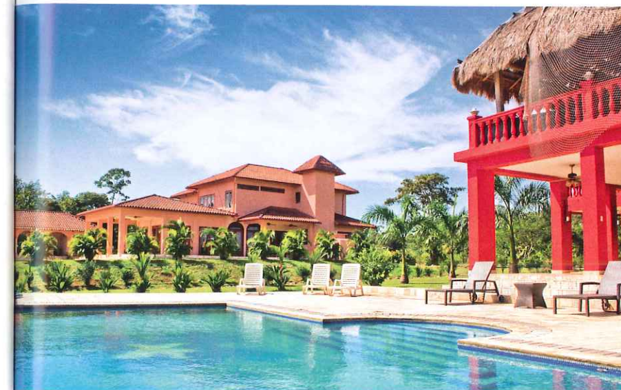
Piscinas para adultos y niños y otras amenidades para un día de relajación. | Swimming pools for adults and children and other amenities for a relaxing day.