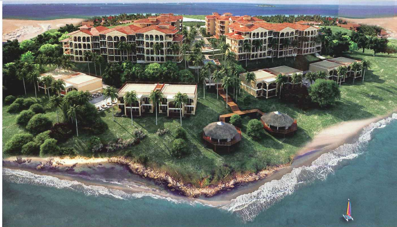
El Proyecto está localizado a 75 kilómetros de la ciudad de Panamá | The Project is located 75 kilometers from the city of Panama.