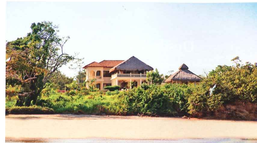
Desarrollo verde sostenible. | Sustainable green development.

Ya hay listas nueve lujosas residencias, y en marzo se inicia la construcción de otras 17 viviendas para aquellos que buscan un estilo de vida interesante y disfrutan del mar. Además para los que les gusta practicar tenis, golf, pesca, buceo, snorkeling o cualquier deporte acuático.